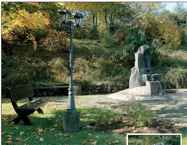
Jodokusbrunnen in der Ortsmitte von Langenfeld.