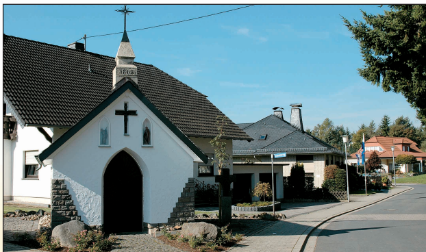
Kapelle Vierzehn Nothelfer, erbaut 1868.

Der Heilige Jodokus, nachdem der Weg benannt ist, wird in der Wallfahrtskapelle St. Jost im Nitztal verehrt. Er lebte und wirkte im 7. Jahrhundert in der Bretagne (Nordfrankreich). Die Gläubigen pilgern an den beiden letzten Wochenenden im September und den beiden ersten im Oktober nach St. Jost ins Nitztal. Sie beten dabei für körperliche Unversehrtheit.